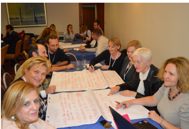
Radionica o združenim studijima

O međunarodnoj dimenziji visokog obrazovanja govorilo se u radionici o združenim studijima i preprekama koje se javljaju u njihovoj organizaciji i provedbi.