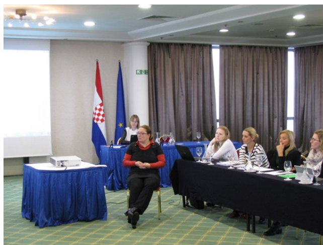
Predstavljanje metodologije za izradu standarda kvalifikacija

nosno kako se popunjava Zahtjev za upis standarda kvalifikacije u Registar HKO-a.