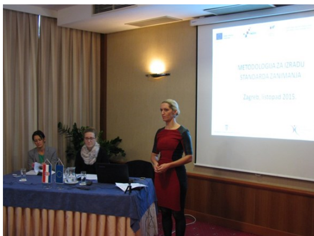
Predstavljanje metodologije za izradu standarda zanimanja

U izradi standarda potrebno je povezati u konzorcije visoka učilišta koja izvode studentske programe i ostale relevantne dionike poput poslodavaca i strukovnih udruga. Od presudne je važnosti da prvi izgrađeni standardi budu kvalitetni, što će se osigurati konzultacijskim dijalogom sa sektorskim vijećima HKO-a kako bi izrada standarda od rane faze bila usklađena s metodologijom HKO-a i osigurala svoj upis u Registar HKO-a.