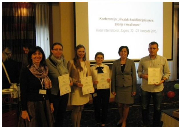
Dodjela nagrada mladim istraživačima

O međunarodnoj dimenziji visokog obrazovanja govorilo se u radionici o združenim studijima i preprekama koje se javljaju u njihovoj organizaciji i provedbi.