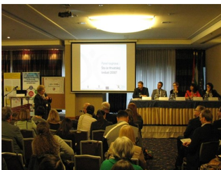
Panel rasprava „Što će Hrvatskoj trebati 2030. g.?”

Zahvaljujući primjeni ovog modela moguće je dobiti podatke o trendovima u zapošljavanju po sektoru i stopi aktivnosti na tržištu rada, a primjenom daljnjih modela i trendovima u zapošljavanju u sektoru po zanimanjima i kvalifikacijama. Izlaganje g. Kvetana poslužilo je kao poticaj za panel raspravu na kojoj su istaknuti stručnjaci iz perspektive svog područja rada i profesionalnog interesa ponudili odgovor na pitanje „Što će Hrvatskoj trebati 2030. g.?”