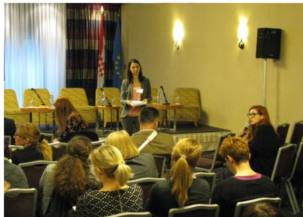
Predstavljanje HKO projekata

Nositelji projekata prezentirali su svoje projektne ideje, planirane ili ostvarene rezultate ili neka od otvorenih pitanja na koja nailaze tijekom provedbe projekta, a izložili su i plakate koji se odnose na teme prezentacija.