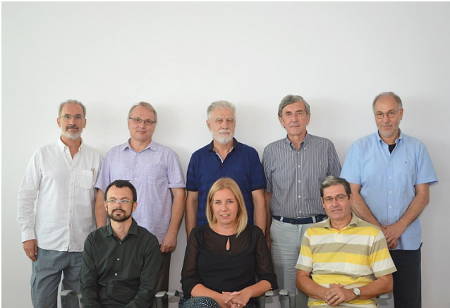
Posebno stručno povjerenstvo za provedbu Strategije obrazovanja, znanosti i tehnologije i koordinaciju strategija i djelovanja na području obrazovanja i znanosti