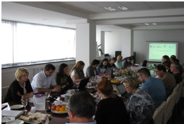
Deveta sjednica Nacionalnog vijeća za razvoj ljudskih potencijala

U Ministarstvu znanosti, obrazovanja i sporta 11. rujna 2015. održana je 9. sjednica Nacionalnog vijeća za razvoj ljudskih potencijala.