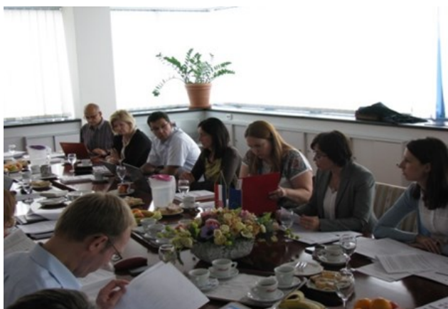
Deveta sjednica Nacionalnog vijeća za razvoj ljudskih potencijala

Članovima Nacionalnog vijeća predstavljen je model financiranja visokih učilišta koji se temelji na programskim ugovorima. 11. rujna 2015. održana je inicijalna radionica o programskim ugovorima za rektore i prorektore visokih učilišta, na kojoj su stručnjaci Svjetske banke ponudili savjetodavne usluge Ministarstvu znanosti, obrazovanja i sporta i visokim učilištima u pripremi za sklapanje cjelovitih programskih ugovora.