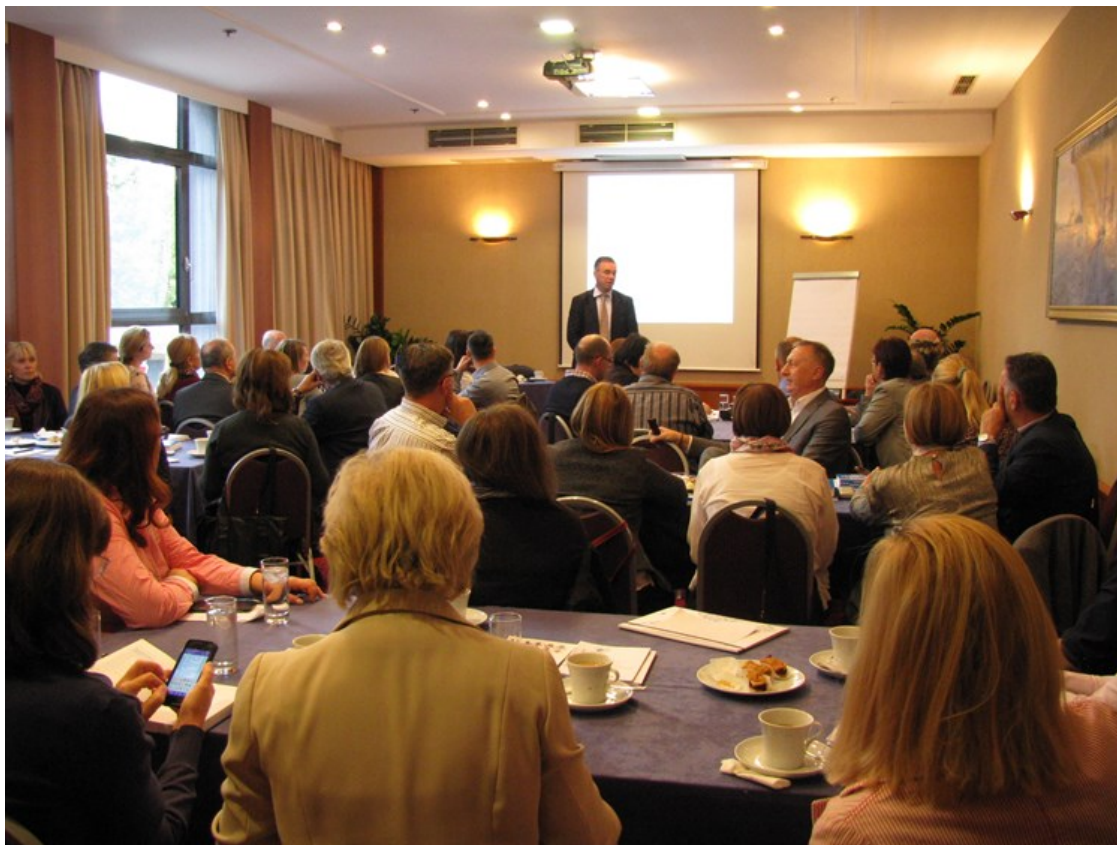
Radionica “Provedba Hrvatskoga kvalifikacijskog okvira”

Održavanje sjednica i radionice za članove sektorskih vijeća omogućeno je u okviru projekta Potpora radu HKO Sektorskih vijeća i ostalih dionika u procesu provedbe HKO-a .