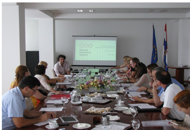
Deseta sjednica Nacionalnog vijeća za razvoj ljudskih potencijala

Članovima su predstavljene i preporuke sa završne konferencije projekta „Garancija za SVE mlade“ (Opatija, 7. srpnja 2015.) čiji je cilj povećati uključенost mladih iz alternativne skrbi u tržište rada, pri čemu se preporučene mjere odnose na tečajeve, udžbenike, stipendije, voloniranje i dodatne edukacije uz rad namijenjene mladima koji su izašli ili se pripremaju za izlazak iz domova, odnosno udmiteljskih obitelji.